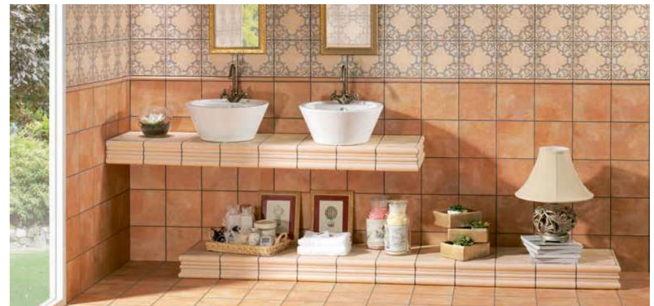
Barro Ocre 20x20 · 8"x8" · Barro Crema 20x20 · 8"x8" · Decor Barro 1 20x20 · 8"x8" · Moldura Barro Crema 5x20 · 2"x8" · Torelo Barro Crema 2x20 · 1"x8" · Torelo Barro Ocre 2x20 · 1"x8"